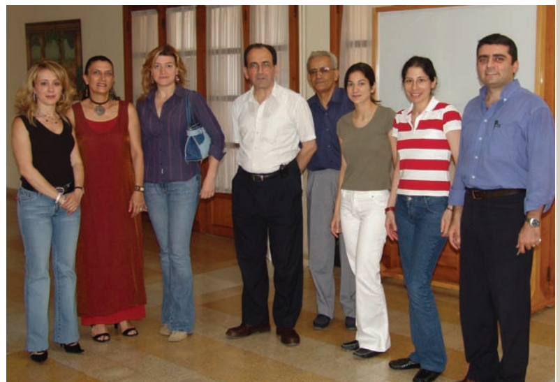
2005, avec l'équipe du Nous du Collège

« Tour à tour élève, prêtre, père spirituel [...], il a su garder, au fil des années, une âme d'enfant avec pour conducteur un flot d'amour qui l'emporte pour irriguer un " monde assoiffé de paix, de justice et d'amour " ». De l'empathie, un don d'écoute mais aussi de la rigueur dans les réponses, tel est le P. Alex. Quand il vous écoutait, vous saviez qu'il était là pour vous, et rien que pour vous, en dépit de ses mille autres occupations. Nulle démagogie dans ses réponses, mais une rigueur bienveillante et un réconfort certain.