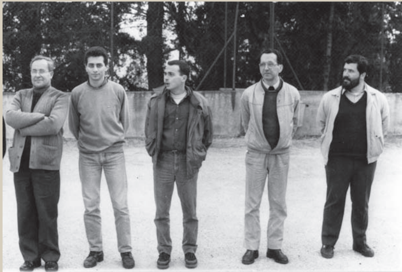
Février 1988, des Pères de la Communauté de Jambour